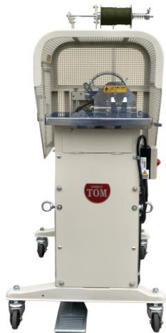
Y10A型『和洋菓子結束機』 作業性UP! (結束時間 1.7秒/結束)